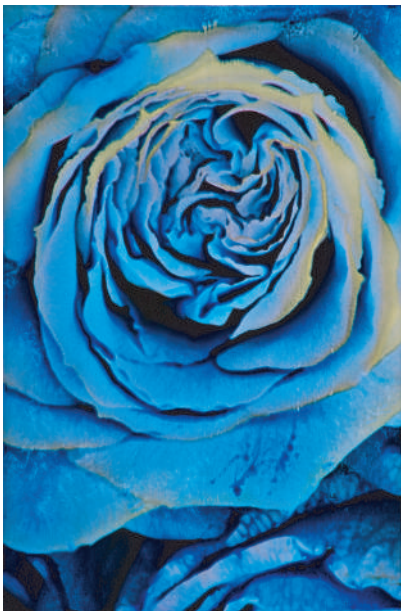
[La vie en rose 02] 撮影:2013年 制作:2014年 個人蔵