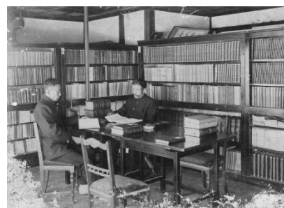
海東郡立戦勝記念図書館 (1909 年)

そのため、本書は図書館とそれに関連する地域史調査についても有用な資料集となっています。「津島市立図書館から読み解く歴史資料」として参照いただければ幸甚です。