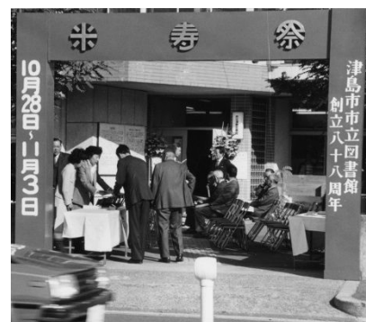
図書館米寿祭 (1983 年)