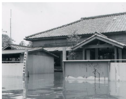
昭和 36 年 6 月水害 (1961 年)