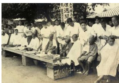
「健康週間」での散髪