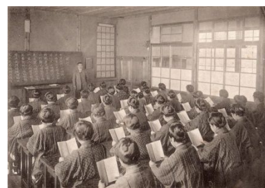
津島高等女学校の授業風景