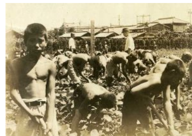
報国農場での勤労