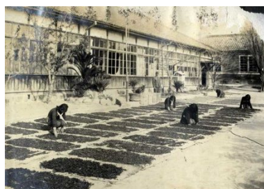
供出用のイナゴ干し