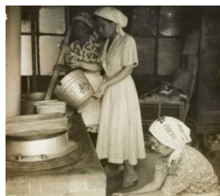
新設の給食調理設備